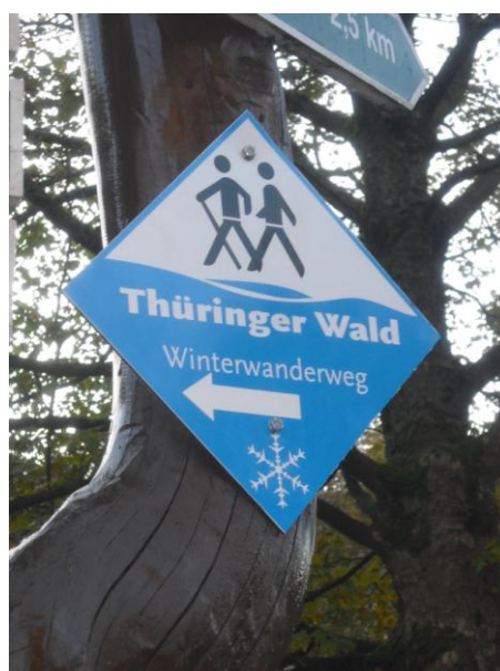
Abbildung 4 Winterwanderwege Beschilderung