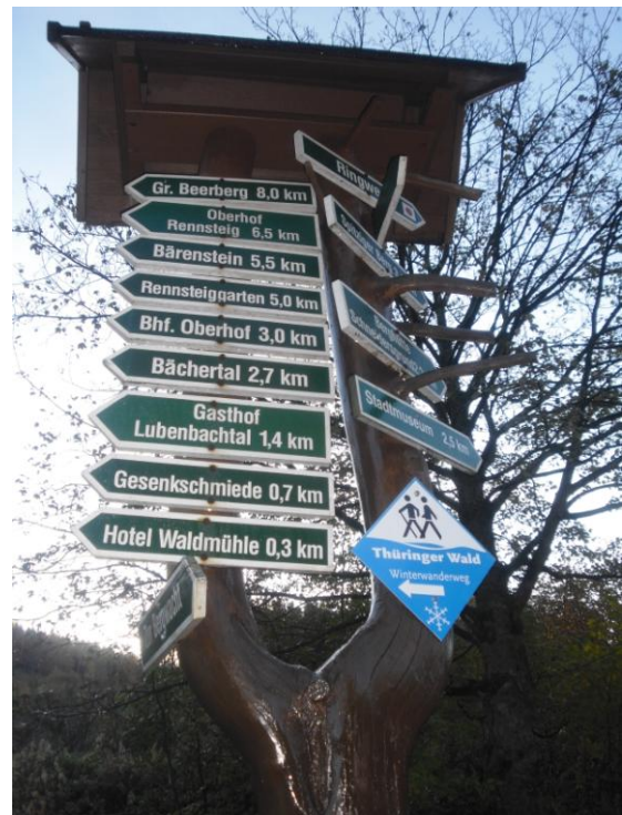
Abbildung 3 Wegweiser Lubenbachtal Zella-Mehlis

An Masten für Straßenbeleuchtung oder ebenfalls an vorhandenen Wegweisern