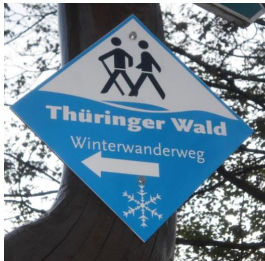
Abbildung 1 Beschilderung Winterwanderwege

Äquivalent zur Beschilderung von Skiwanderwegen dient das Winterwanderwege-Schild zur Kanalisierung verschiedener Nutzungsarten von Wegen.